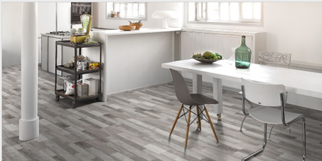
Parador Classic 2050 Parkett – allfloors.de berät bei Fragen ( http://parador.de )

Für das Team von allfloors.de war das Anlass genug, sich hinzusetzen, und sich Gedanken darüber zu machen, wie diese Fehlkäufe zu vermeiden sind. Heraus kam ein Konzept, das alle Bedürfnisse von Kunden abdeckt.