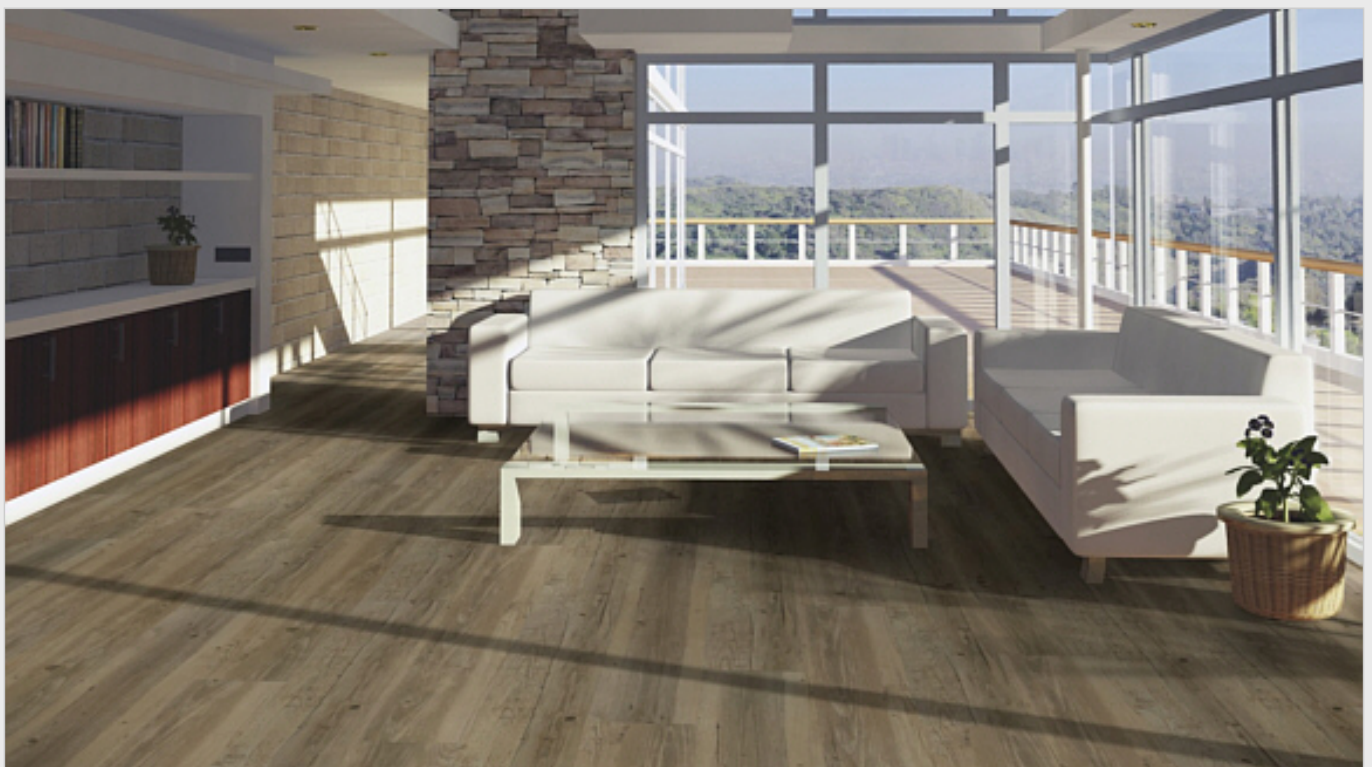
Wineo Bacana Wood Designbelag mit naturrealistischen Haptiken und Optiken