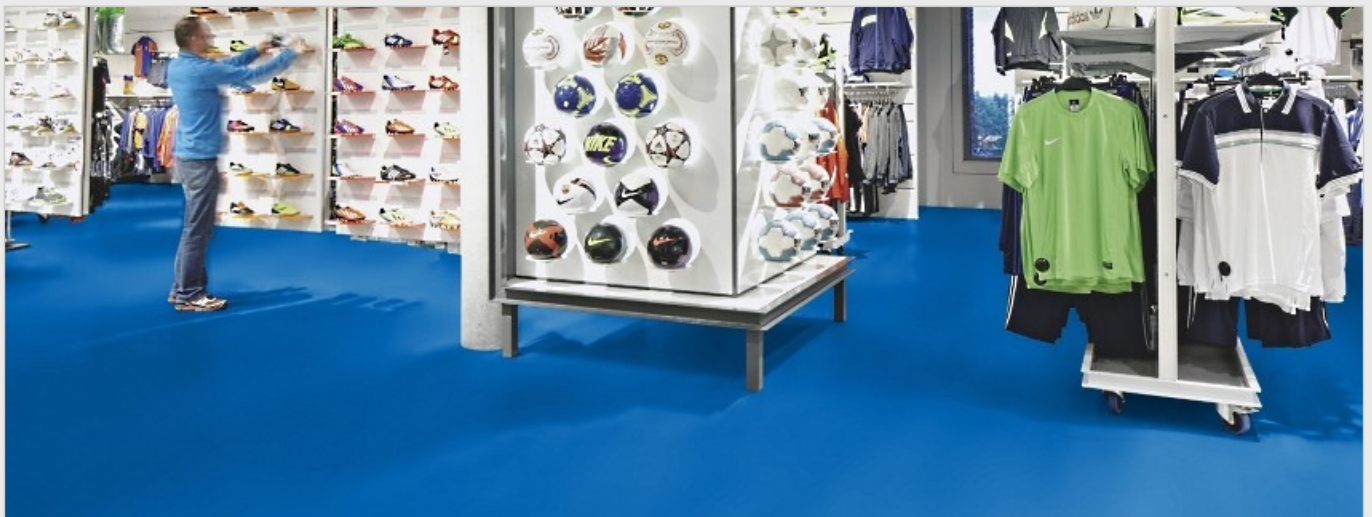
Vinylboden als Messe-PVC-Boden für Messebau und Events

Messe Teppichboden wird überall dort eingesetzt, wo textiler Bodenbelag (Messe-Teppich) nur für einen begrenzten Zeitraum benötigt wird, wie zum Beispiel auf Messen, Events oder Ausstellungen. Messe-Teppich bzw. Messe-Teppichboden erfüllt Anforderungen an die Brandschutzklasse sowie der Rutsicherheit. Messe-Teppichboden ist sehr günstig und schnell zu verlegen. Es stehen viele Farbvarianten auch in knalligen Farben zur Verfügung. Auf Anfrage und bei bestimmter Abnahmemenge ist die Fertigung von Messe-Teppich mit Logos nach Kundenwunsch möglich. Textile Bodenbeläge für Messen sind in Ihrer Strapazierfähigkeit reduziert und meist nur als Rollenabnahme erhältlich. Aber auch hochwertige Teppichböden für exklusive Messe-Events sind auf allfloors.de zu günstigen Preisen verfügbar.