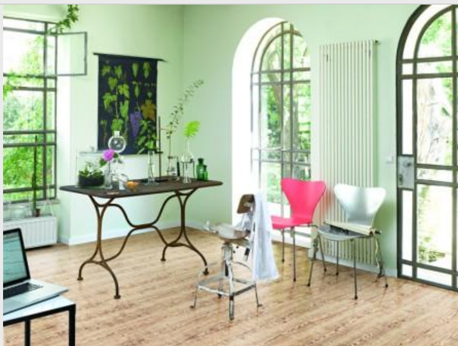
Parador – living performances – PARADOR

Original frappierend ähneln. Mit dem Design und der hochwertigen Qualität bietet das Laminat somit eine kostengünstige Alternative zu den teureren Original-Bodenbelägen.