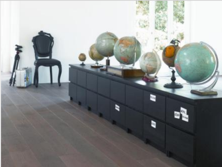
Pardor – living performances – PARADOR