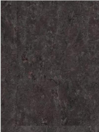
Wineo Ambra Multi- Layer Vinyl Parkett Dakar Stone auf auf HDF Klicksystem

Gerflor Senso Designbelag SK Urban selbstklebende Vinyl Dielen Subway dunkel Fliese 305 x 609 mm, 2 mm stark, 2,22 m 2 pro Paket, NS: 0,2 mm Preis günstig