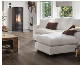
Modernes Landhausstil Wohnzimmer mit XL... 2 Foto(s)